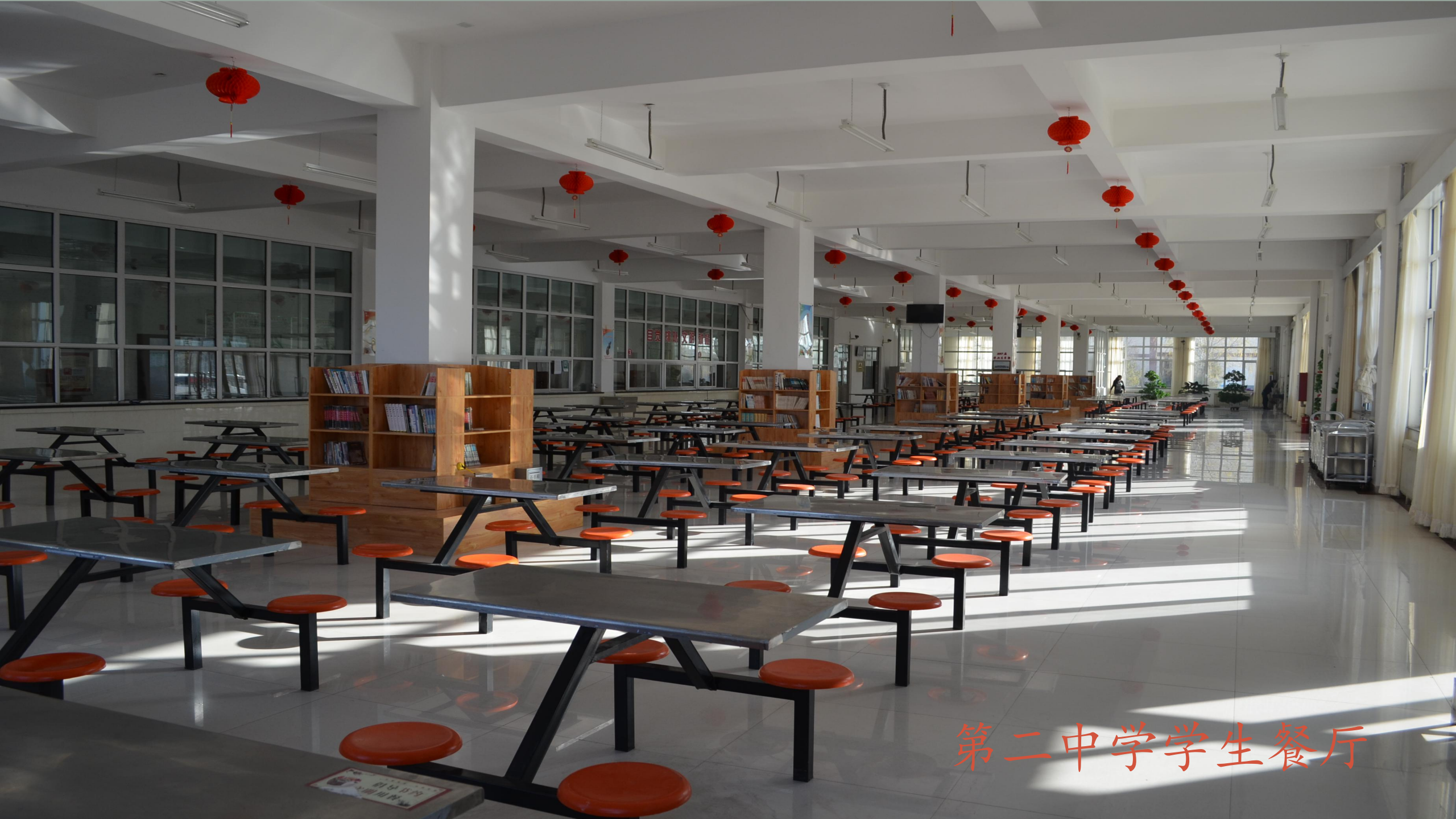
第二中学学生餐厅